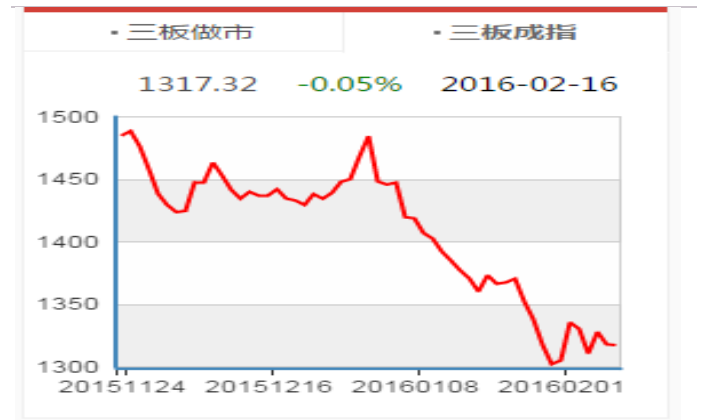
图表2： 新三板成分指数